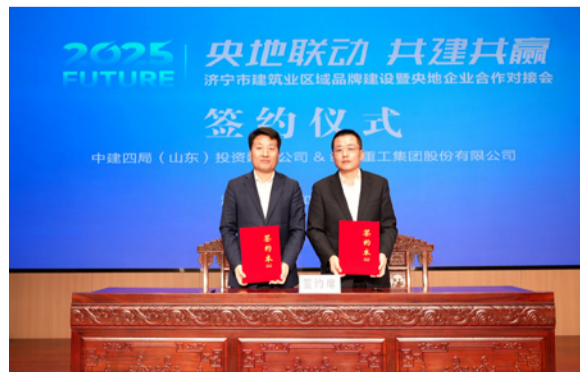
中建四局投资建设有限公司与经典集团签约