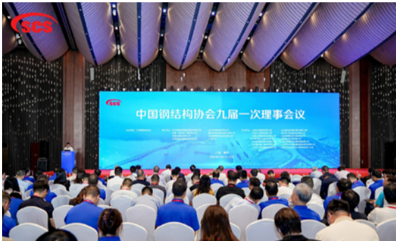
中国钢结构协会第九届会员代表大会暨2025中国钢结构大会在南宁盛大召开

造、科技研发、绿色低碳等关键领域持续突破，取得丰硕成果，为推动行业技术升级与创新发展提供了经典智慧与经典方案。展望未来，经典集团将持续聚焦钢结构行业发展，深化智能制造与绿色建造的协同融合，积极探索新业态与新模式，构筑竞争发展新优势，激发创新发展新动能，为推动钢结构行业高质量发展贡献更多力量。