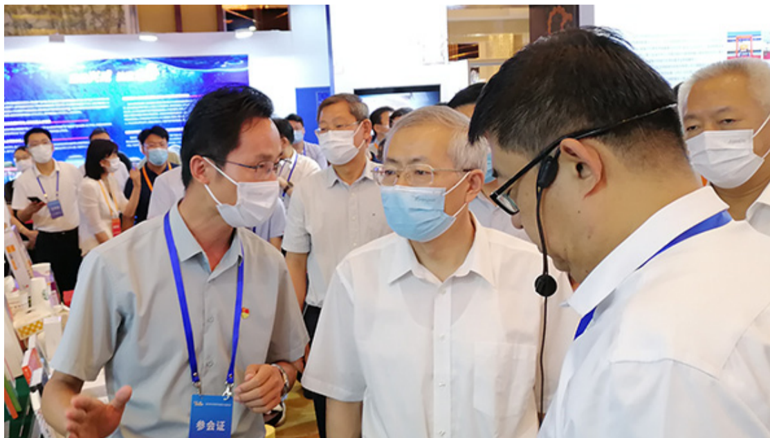
人力资源和社会保障部副部长汤涛、山东省政府党组成员副省长凌文等领导参加活动

人力资源和社会保障部副部长汤涛、山东省政府党组成员副省长凌文、济宁市委副书记市长于永生、兖州区委书记王庆等领导参加活动时，在经典集团的展位前驻足良久。看到企业在技能人才和北京大兴机场等项目建设成果模型的展示，饶