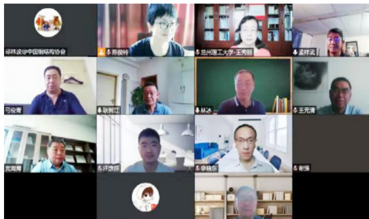
中国钢结构协会团体标准《高耸钢结构工程检测与评定技术规程》送审稿通过审查