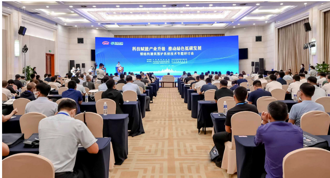
中国钢结构建筑围护系统技术专题研讨会在山东济宁胜利召开

集团引入智能生产设备深耕钢结构加工制造的同时，在2021年成功引进国际先进生产线，全新打造“凯思诺”高端金属面围护系统品牌，围护系统生产基地顺利建成投产，年产钢结构产品36万吨、配套围护产品百万平方。秉承“让建筑成为艺术”的宗旨，实现产品尺寸模数化、现场安装装配化、可大幅降低耗能、