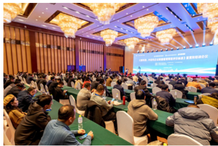
《建筑钢、木结构企业质量管理等级评价标准》宣贯和培训会议现场

量分级评价标准。标准的实施对于开展钢木建筑质量提升行动，保障建筑品质，防范质量风险，推动质量管理体系、标准体系、信用体系、社会保障体系、监管体系和服务体系建设，打造一批具有国际竞争力的品牌，促进建筑产业高质量发展具有重要意义。